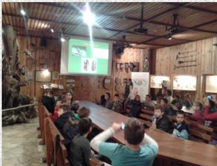
Wykład w Sali Myśliwskiej.

9 stycznia 2014 r. nasza klasa wraz z klasą III A pod opieką swoich wychowawczyń w ramach realizacji projektu Fascynujący Świat Nauki i Technologii odbyła wycieczkę do Nadleśnictwa w Opolu. Natomiast dziewczynki były w Ludowym Klubie Jeździeckim „LEWADA” w Zakrzowie, który specjalizuje się w ujeżdżeniu koni.